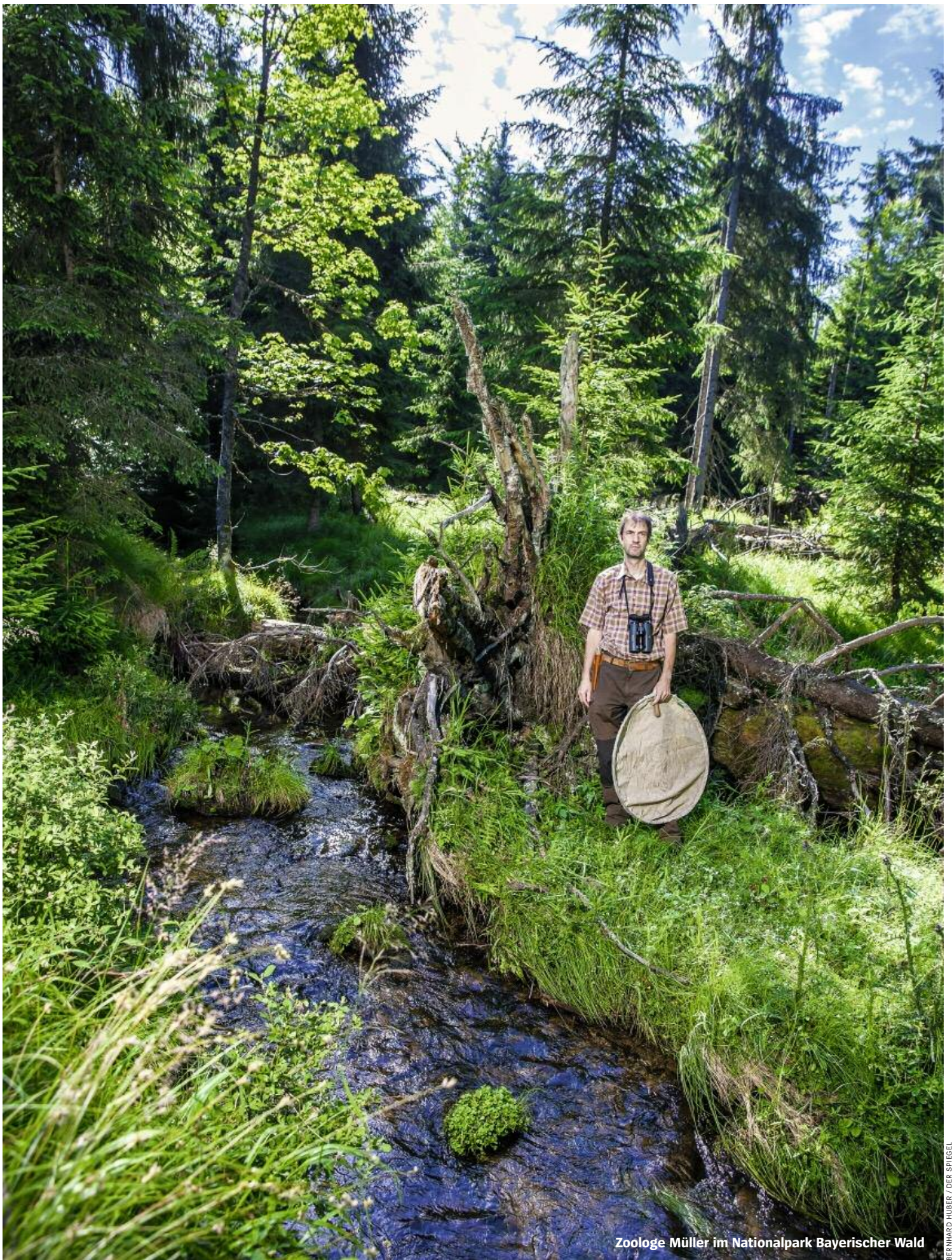
Zoologe Müller im Nationalpark Bayerischer Wald